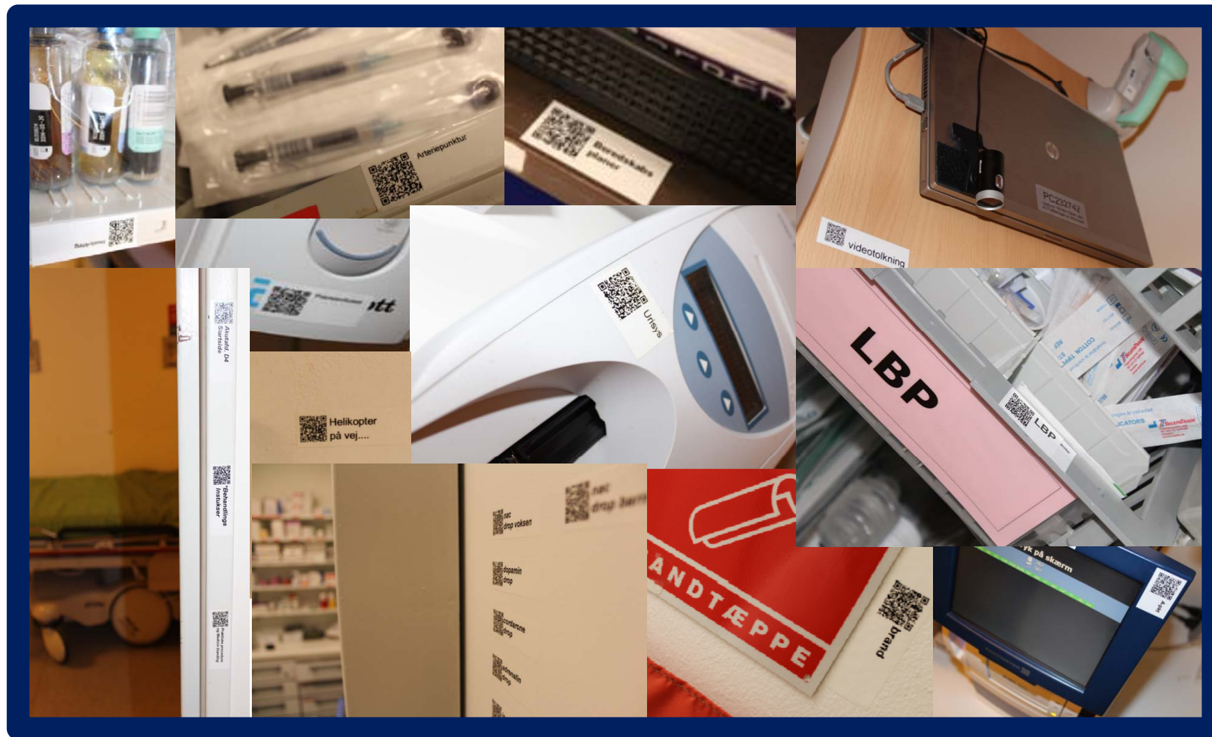
Poul Mossin Ledende oversygeplejerske. Akutafdelingen Køge Sygehus